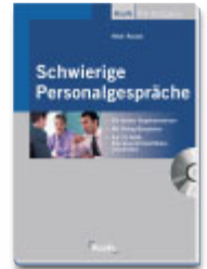
Schwierige Personalgespräche Buch mit CD € 24,80