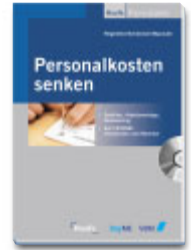
Personalkosten senken Buch mit CD € 34,80